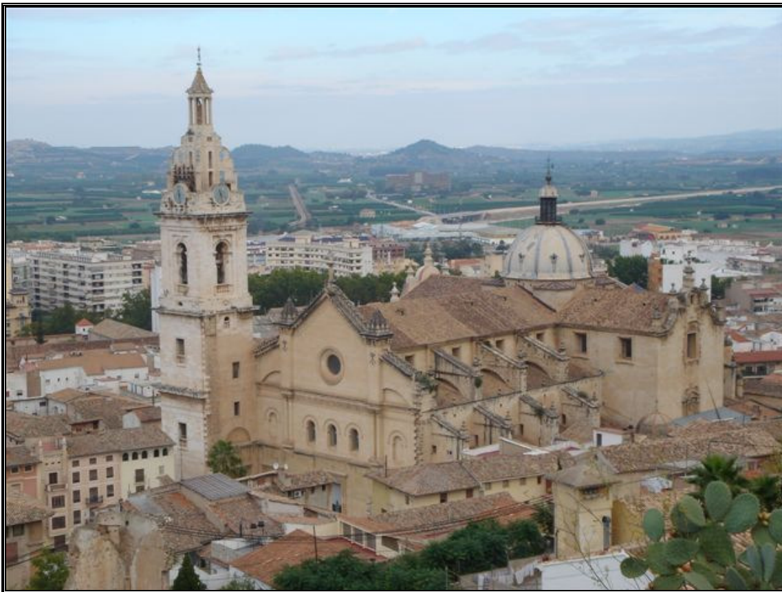
Il·lustración 1: Vista de la Seu

Punt de Trobada: Font del Lleó (Albereda Jaume I núm. 50)