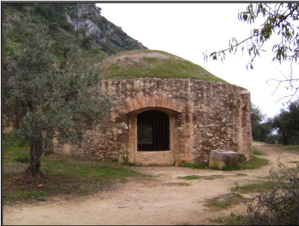
Ilustración 2: La Nevera en la Costa del Castell